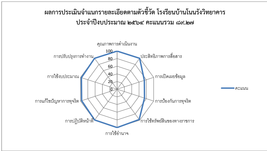
แผนภาพที่ ๒ ผลการประเมินจำแนกรายละเอียดตามตัวชี้วัด

หลังจากการร่วมวิเคราะห์ผลการประเมินคุณธรรมและความโปร่งใส คณะกรรมการฯ ตามโครงการเสริมสร้างคุณธรรม จริยธรรม และธรรมาภิบาลในเขตพื้นที่การศึกษา มีตัวชี้วัด ทุกตัวชี้วัด ที่มีค่าคะแนนตั้งแต่ว้อยละ ๙๕ คะแนน ขึ้นไป